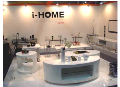
▲展覽主題-室內家具 (Colin Ross)