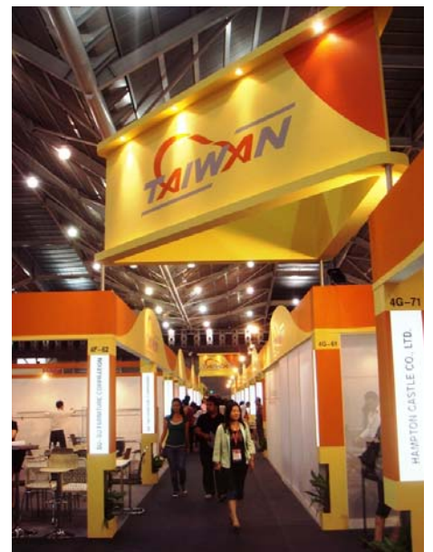
▲ IFFS 2010 台灣館外觀